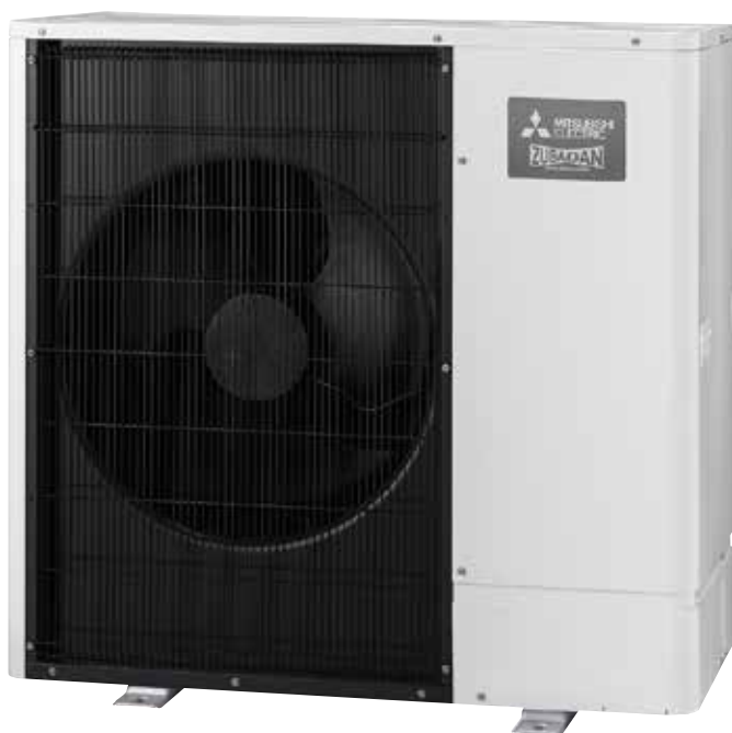
Unità esterna Zubadan

Ecodan R290 è una gamma di pompe di calore aria-acqua in versione "idrosplit" che adotta il propano come refrigerante, virtualmente a zero emissioni, collegabile a moduli Hydrotank con accumulo sanitario da 170-200-300 litri. Ideale per le riqualificazioni degli edifici esistenti poiché è in grado di raggiungere una temperatura di mandata di 75°C, idonea a riscaldare in modo efficiente con i radiatori già presenti nelle abitazioni e a ridurre i tempi di ripristino sanitario.