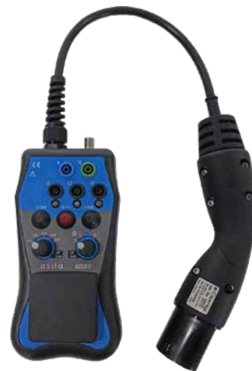
AS50EV Unità simulatrice del veicolo elettrico in carica.

Tramite tre semplici comandi, è inoltre possibile simulare facilmente condizioni di guasto/errore quali: diodo in corto circuito, conduttore PE aperto ed errore sul segnale di controllo CP.