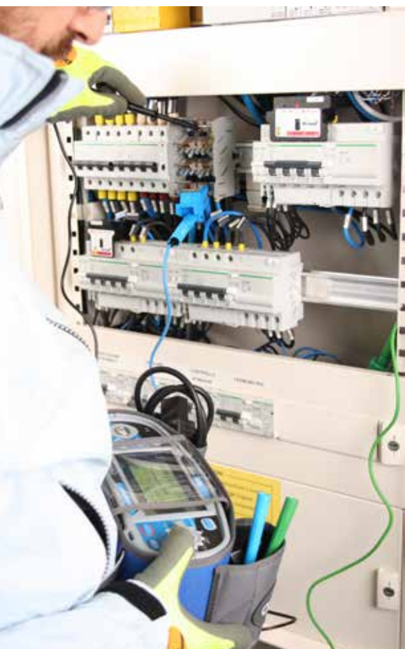
Utilizzo dello strumento AS5060, dotato di comoda cintura che si allaccia in vita per un comodo utilizzo in campo.