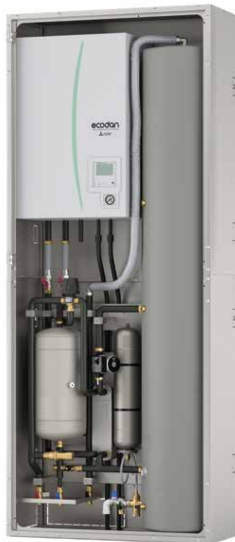
Unità esterna inWall 2.0