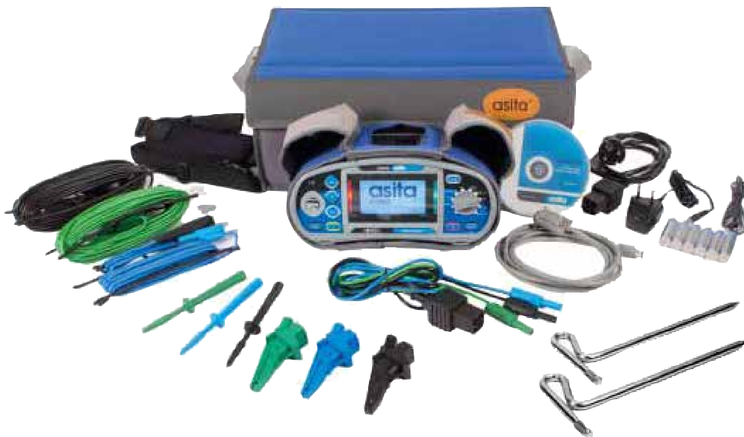
AS5060 con accessori in dotazione.